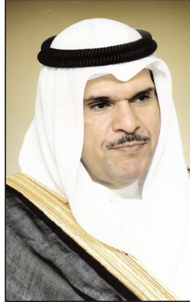
وزير الإعلام الشيخ سلمان صباح السالم الحمود الصباح

الأولى حول عرائس الماريونيت، والثانية حول تكوين المشهد المسرحي في خيال الظل.